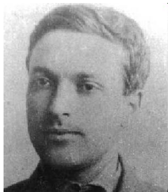
Л. С. Выготский (1832—1920 гг.)

определял возраст как относительно замкнутый период развития, имеющий собственное содержание и динамику. С его точки зрения, хронологический возраст и психологический возраст — два разных, несовпадающих понятия.